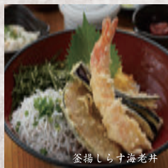
釜揚げしらす海老丼