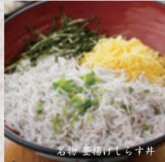
名物 釜揚げしらず丼