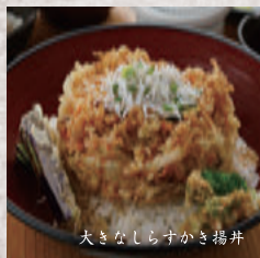
大きなしらすかき揚げ丼